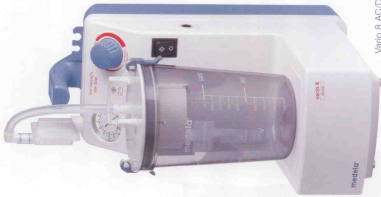
Vario 8 AC/DC